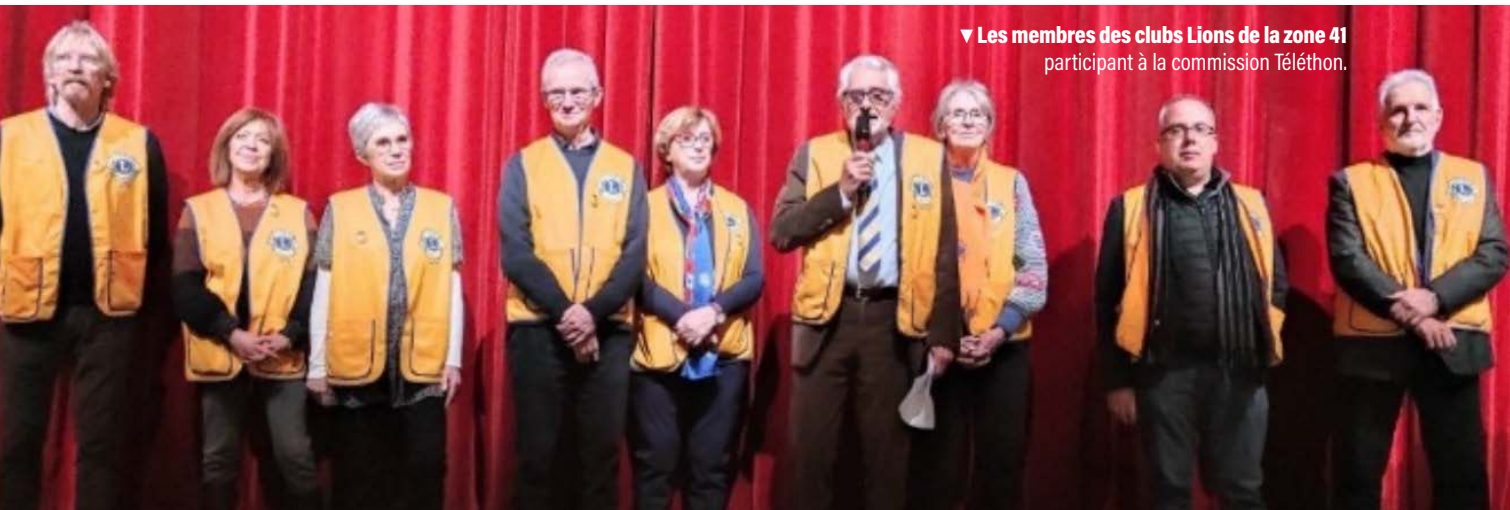
▼ Les membres des clubs Lions de la zone 41 participant à la commission Téléthon.