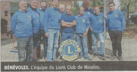
BÉNÉVOLES. L'équipe du Lions Club de Moulines.

Grosse effervescence dimanche matin, au lycée agricole du Bourbonnais, à Neuvy, où le Lions Club proposait une matinée sportive ouverte à tous, La Boucle des Lions, destinée aux marcheurs, VTTistes, petits ou grands sportifs.